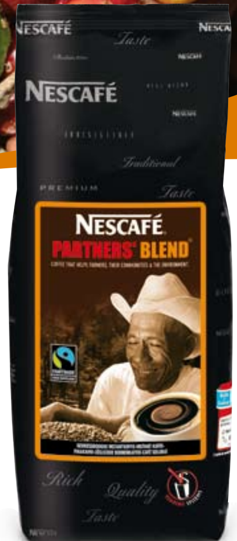
Sachet de 500 g